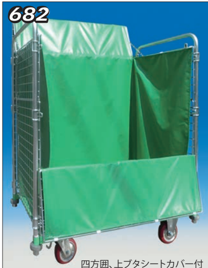
四方囲、上プタシートカバー付