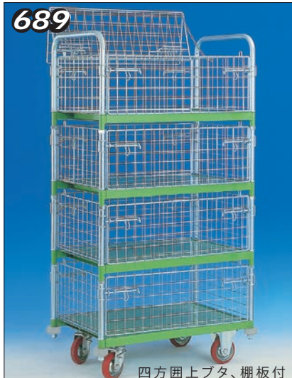
四方囲上プタ、棚板付