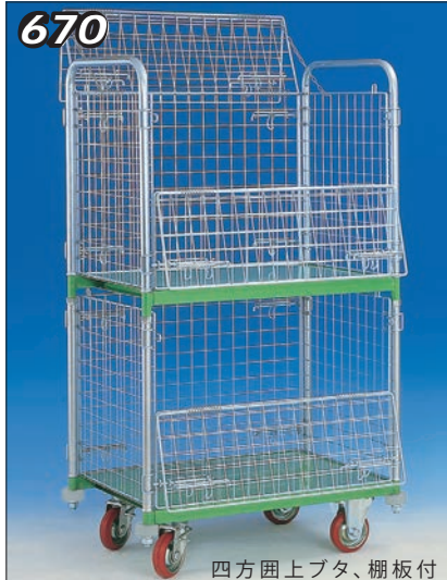
四方囲上プタ、棚板付