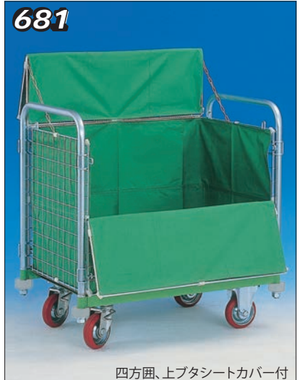
四方囲、上プタシートカバー付