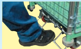
ペダルを踏むと「ブレーキロック」