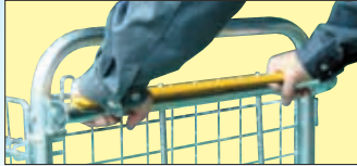
ハンドルを握って「ブレーキ解除」