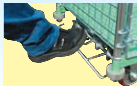
解除ペダルを踏んで「ブレーキ解除」