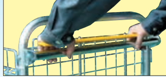
放すと「ブレーキロック」