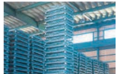
未使用時はフォークリフトで安定した多段積みができます。